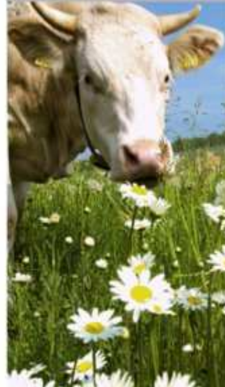
Pflanzen, Tiere, Boden