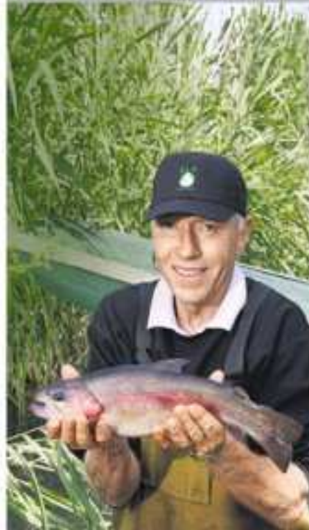
Wasser / Überfischung